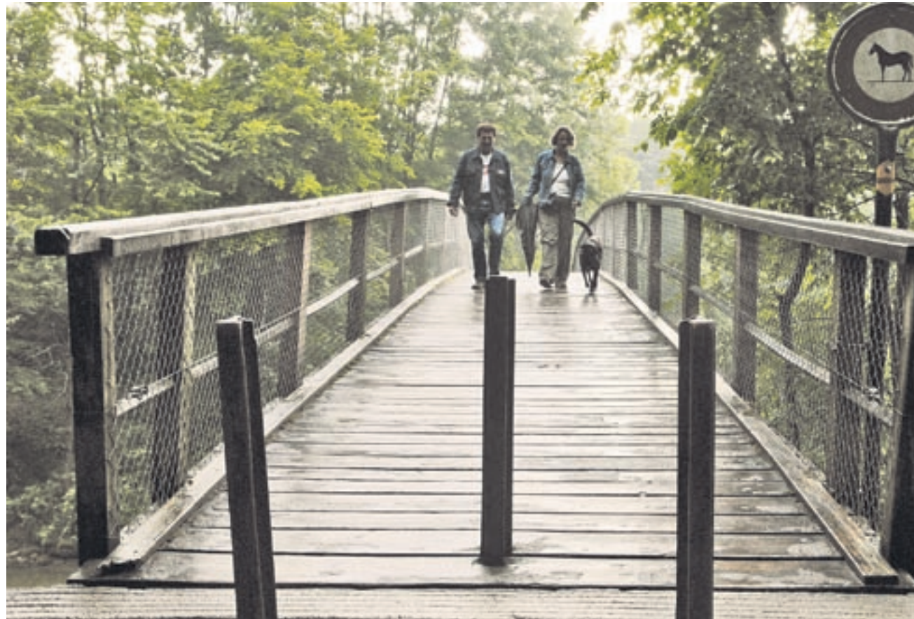
Die Tage des «Chinesenbrüggli» sind gezählt: Die Stadt plant eine neue Tössbrücke rund 400 Meter flussabwärts.

Der Reitplatz soll autofreies Naherholungsgebiet werden. Als Ersatz plant die Stadt auf der «Bleuelwiese», am gegenüberliegenden Tössufer, 150 Parkplätze zu erstellen. Über den nötigen Gestaltungsplan befindet nun der Gemeinderat.