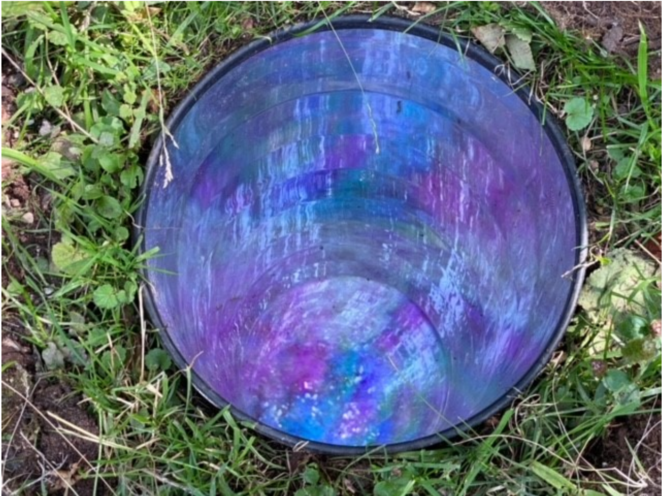
2021: Blick ins LOCH (Olga Titus)