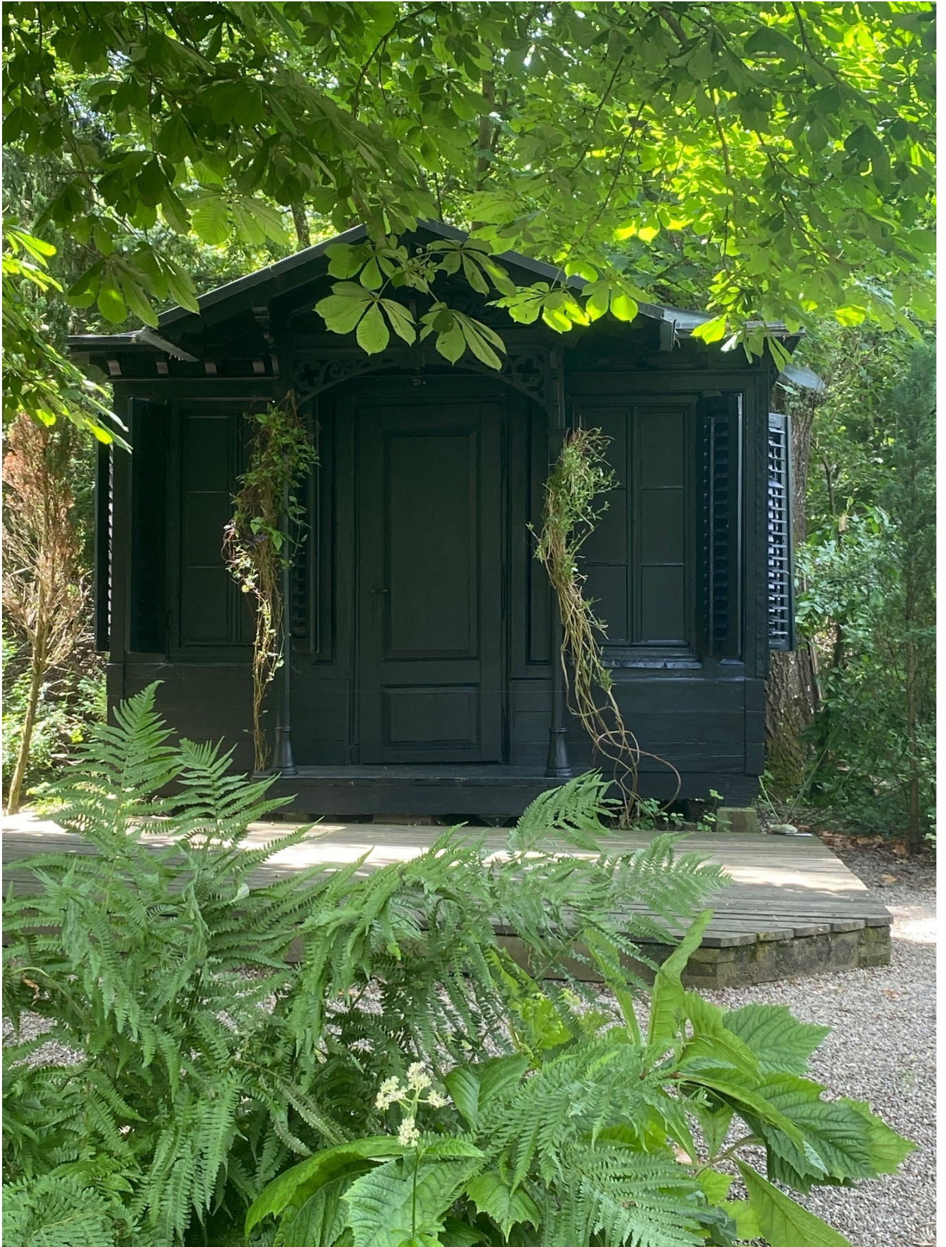
2021: Schwarzes Haus (Isabelle Krieg): Aus dem lieblichen Gartenhäuschen ist ein schwarzes Monument geworden.