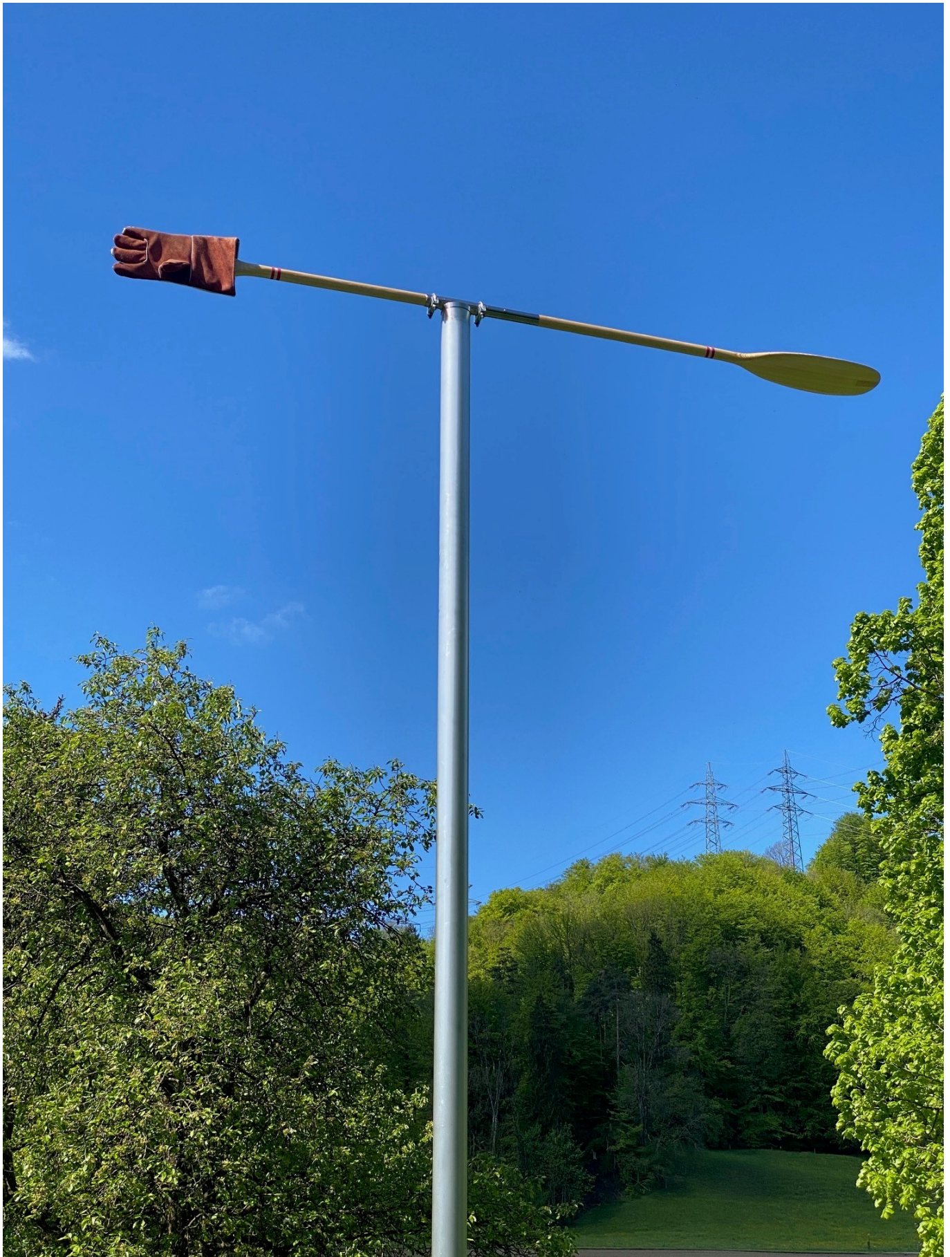
2021: Windfahne (Roman Signer): Die Installation dreht sich im Wind. Wohin der Feuerwehrhandschuh wohl weist?