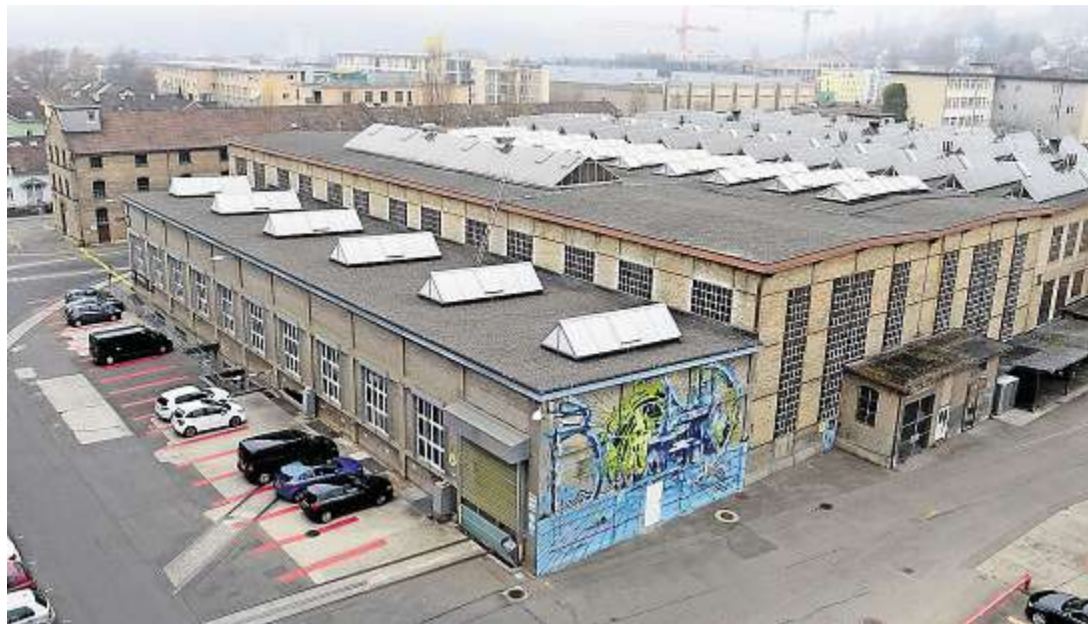
Blick auf das Werk 1. Links befindet sich das Baufeld, auf dem die Genossenschaftswohnungen entstehen.