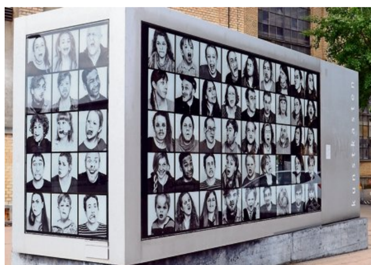
Rund 100 platte Nasen drücken sich derzeit an den Kunstkasten.