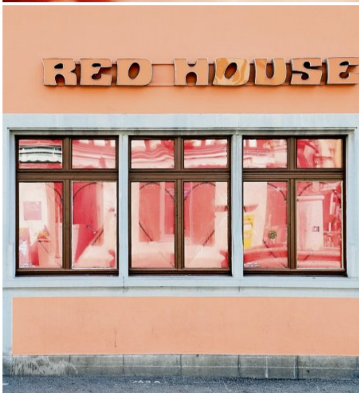
Teurer Champagner und viel Rot: Ins Red House kamen zuletzt fast nur noch ältere Stammkunden. Drinnen hatte eine Frau das Sagen.