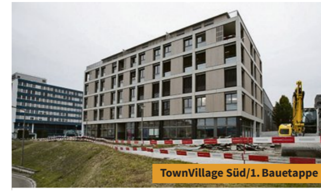
TownVillage Süd/1. Bauetappe